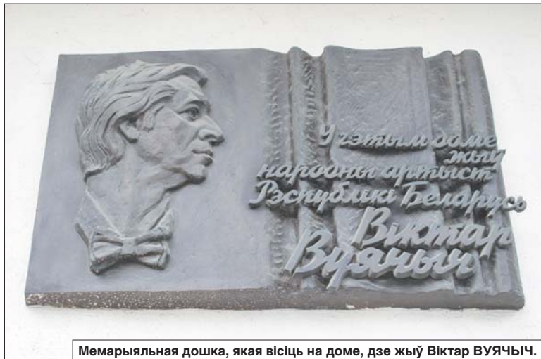
Мемарыяльная дошка, якая вісіць на доме, дзе жыў Віктар ВУЯЧЫЧ.

Лёс не падмануў хлопца. Тут, у Мінску, яго чакалі сямейнае шчасце і поспех у калектыве. Але тады ён яшчэ пра гэта не ведаў.