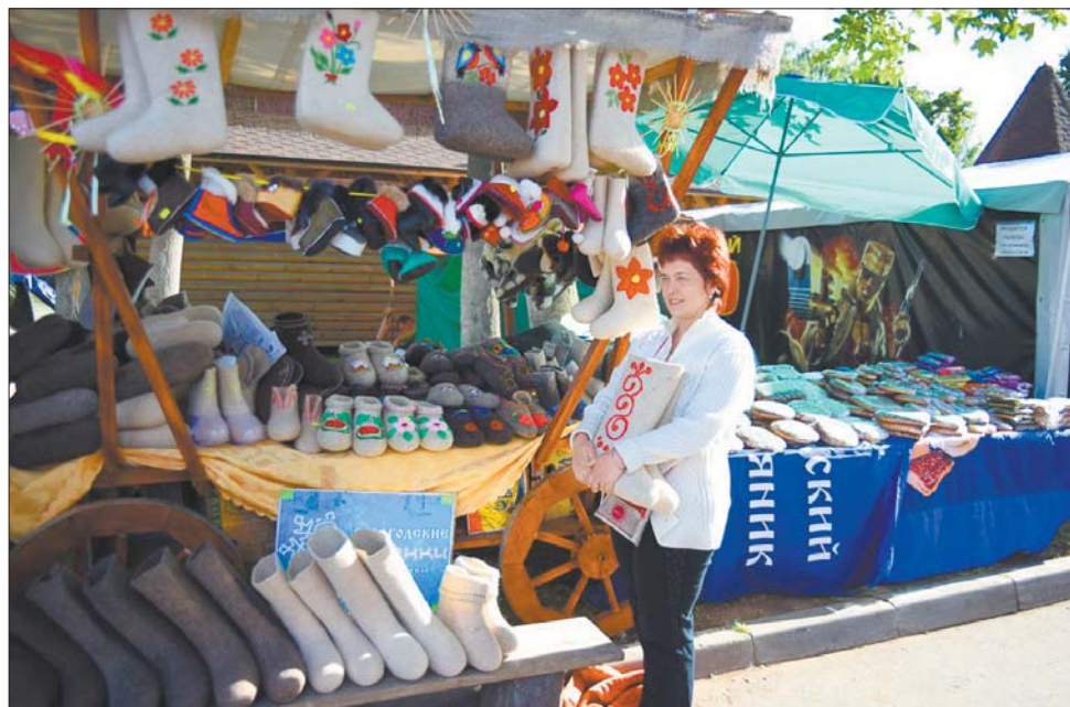
Яна абувае галоўнага расійскага Дзёда Мароза.

— Мы са Львова. Прыехалі жаночай камандай на «Жыгулях» чацвёртай мадэлі. 27 гады ў дарозе — і мы ў Віцебску. Памежнікі здзіўліліся, што без мужчын не баімся так далёка ездзіць. Дык і што? Мы і ў Германіі на кірмашы былі, і не толькі там. Сукенкі і кашулі