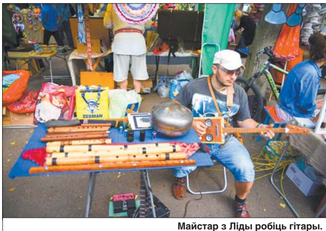
Майстар з Ліды робіць гітары.

У фестывальным «Горадзе майстроў» карэспандэнты «Звязды» пазнаёміліся з унікальнымі рамеснікамі