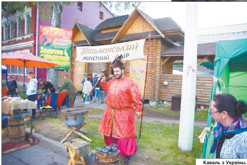
Каваль з Украіны.

— Не толькі раблю інструменты, але і граю ў аматарскім гурце, вучу дзятву граць на гітары ў цэнтры творчасці дзяціў і моладзі. Цыгарныя скрынкі, можна сказаць, «карані блюзу». У бедных чарнаскіх музыкантаў не было грошай, каб купіць гітару. «Палку» давалі і тры струны нацягнулі, вось вам і добры інструмент. Былі цэлыя ансамблі, якія гралі і на самаробных скрыпках, віяланчэлях... Пры вырабе такіх інструментаў выкарыстоўвалі літаральна тое, што на звалках ляжала, — тлумачыць суразмоўца. Прызнаўся, што заказаў на выраб атрымаў ужо дастаткова.