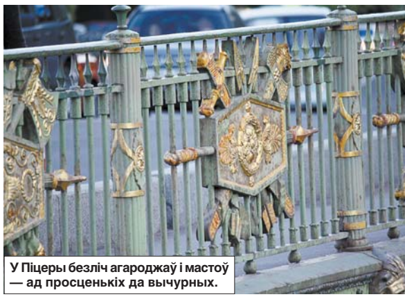
У Піцеры безліч агароджаў і мастоў — ад просценных да вычурных.

як кожны з герояў губляў слых, потым зрок. Як яны едуць на працу, ведаючы кожны крок, які павіны зрабіць, і як ніхто нават не заўважае, што побач сляпы.