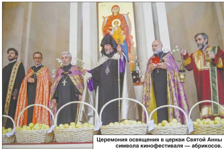
Церемония освящения в церкви Святой Анны символа кинофестиваля — абрикосов.

в Османской империи в начале XX века. Эта программа с начала нынешнего года и демонстрируется на самых престижных кинофестивалях мира.