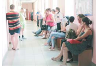
Кастынг на прыбіральшчыцу — 40 чалавек