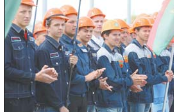
Пуцёўка для студатрада на БелаЭС