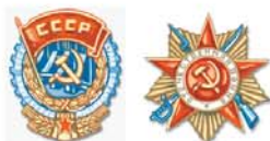
Выдаецца з 9 жніўня 1917 г.