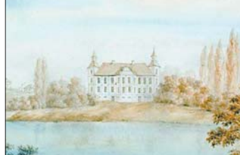
Палац оптам і ў розніцу