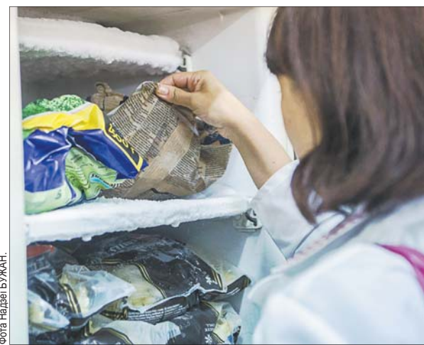
свае дзверы сталічны рэстаран хуткага абслугоўвання «Byblos». Ён на той дзень і стаў аб'ектам правяркі. У Мінгандлі кажучы, што з ёй лепш прыходзіць менавіта пад адкрыццё: «Так можна знайсці больш недахопаў».

Да супрацоўнікаў гандлёвай інспекцыі мы з фотакарэспандэнтам далучаемся каля дванаццаці гадзін дня. Час выбраны не выпадкова. Менавіта апоўдні адчыняе