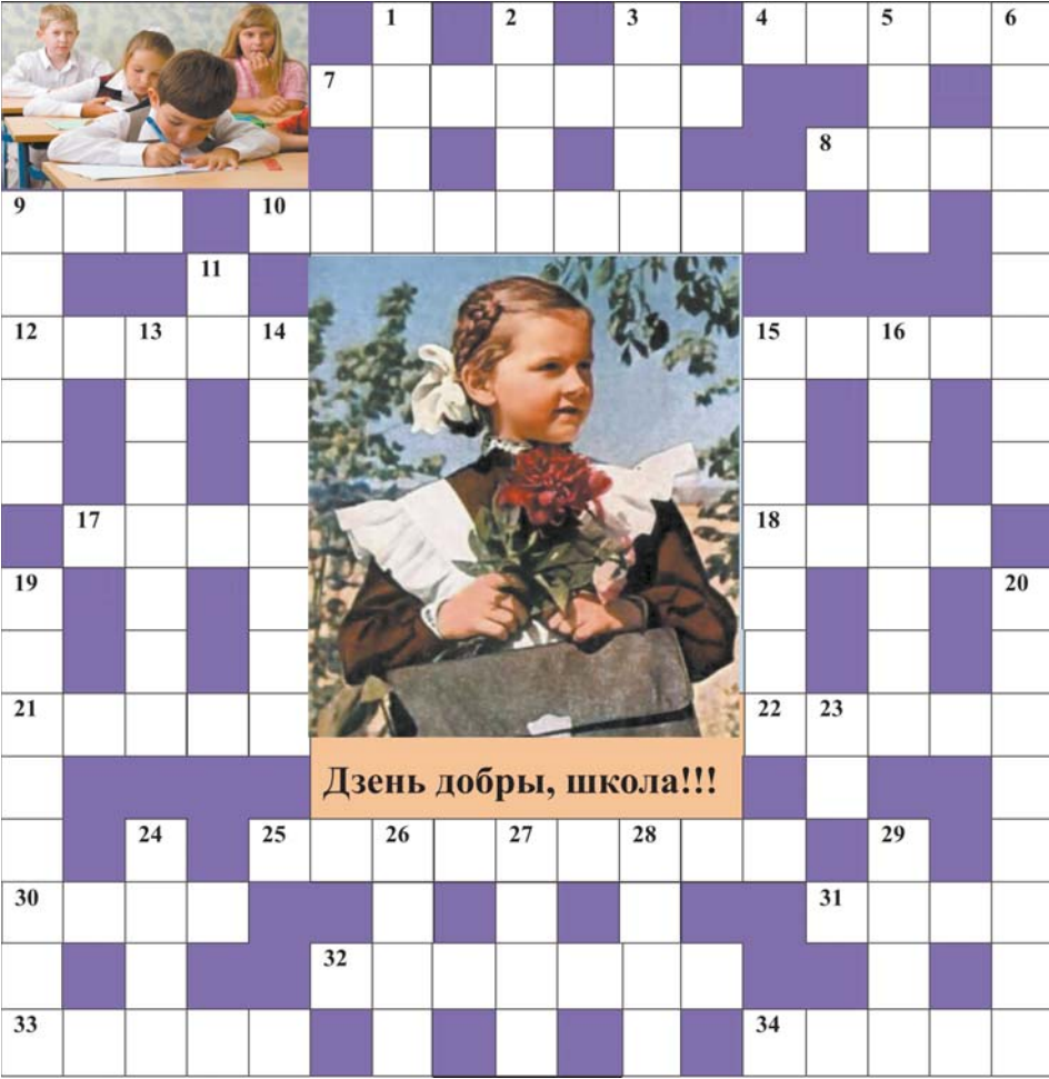
Дзень добры, школа!!!

Па гарызанталі: 4. «Дзень добры, верасень!//Дзень добры, ...!» З верша М. Чарняўскага «Звініць званок».