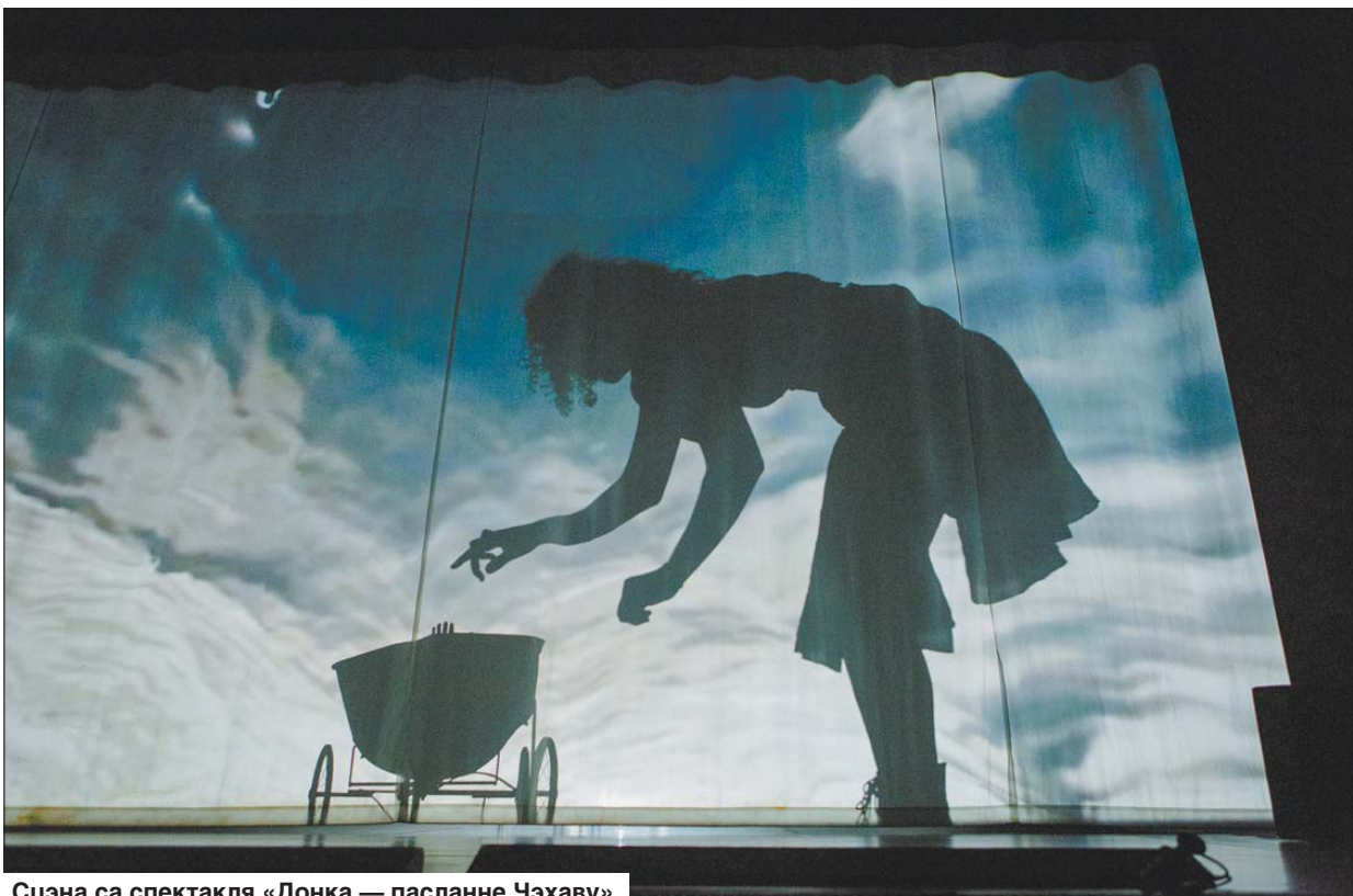
Сцэна са спектакля «Донка — пасланне Чэхаву».