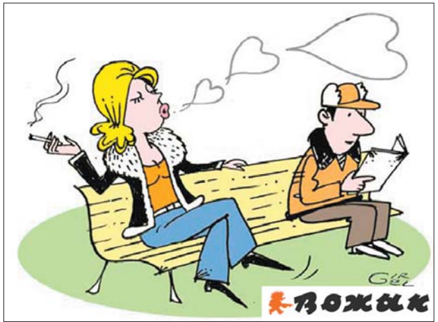
Матэрыял Міколы ГРГЕЦЯ.