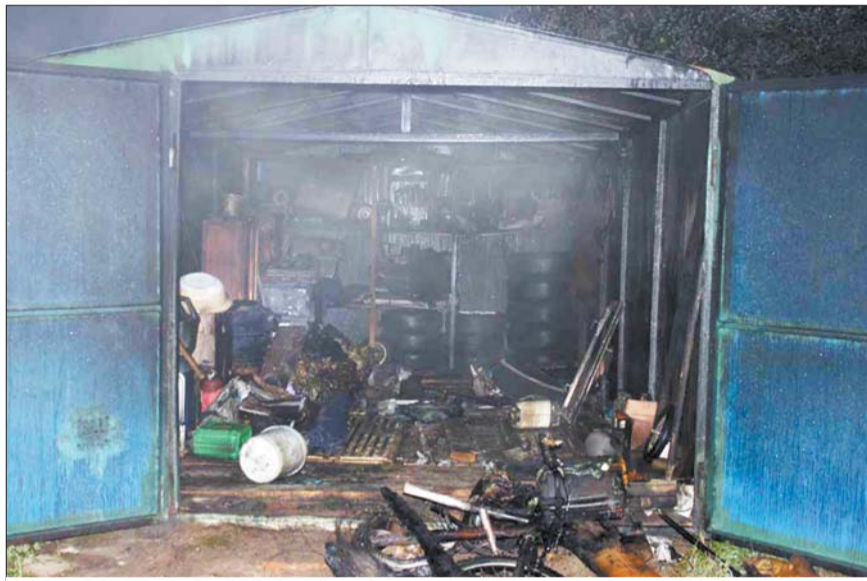
Аднаўленне такога гаража пацягне на вялікі грошы.

— Нават сама наўнасць паліва ў баку — гэта ўжо патэнцыйная пагроза ўзнікнення надзвычайнай сітуацыі. Прычым з цягам часу ў нядбайнага гаспадара гараж рызыкуе ператварыцца ў нейкае падабенства складу рэчэй.