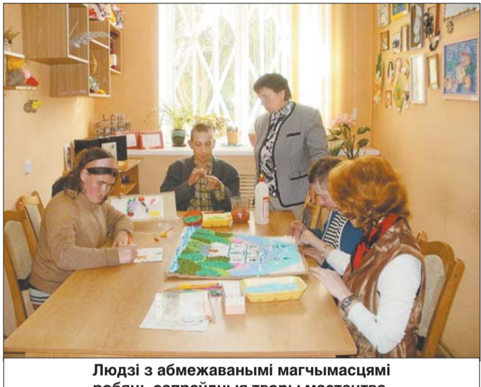
Людзі з абмежаванымі магчымасцямі робяць сапраўдны творы мастацтва.

— Спецыяльна для іх былі створаны новыя рабочыя месцы. У прыватнасці, жанчына займаецца мыццём і сушкай адзення.