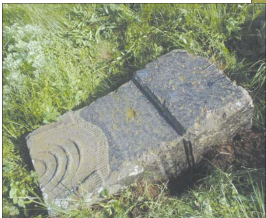
Помнік айцу Уладзіміру Квяткоўскаму. Раней і цяпер.

Яшчэ літаральна летась тут ляжаў, «дагары нагамі» перакулены і напалову ў зямлю ўрослы, пашкодваны часам і кулямі чорны помнік. «Прохожий, помни о кончине своей, помолись о душе моей», — чыталі на яго паверхні цікаўныя і зацікаўленыя, ускараскаўшыся на ўзгорак, хутчэй, дзеля таго, каб зірнуць на каплічку — фамільны склеп паноў Дыбоўскіх, чым на гэты няшчасны помнік. Другі надпіс на ім амаль не чытаўся. Хіба што мясцовыя жыхары, памятаючы тэкст яшчэ з дзяцінства і з часу, калі ён не быў так моцна пашкодваны, маглі працягваюць яго на памяць: «Вот он лежит, отец наш милый, но он не наш уже, увы. Умolk язык его унылый, уста сомкнулись для молвы. Но наше сердце помнит, знает, что наши души его спасают. Привет из гроба вам, друзья, привет тебе, семья моя». Узор эпітафіі пачатку ХХ стагоддзя, калі смерць яшчэ лічылася часткай жыцця, яе веліччым, высакародным фіналам.