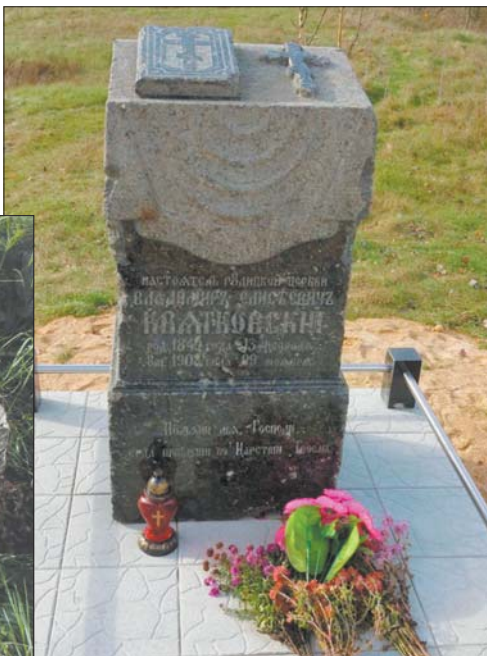
Помнік айцу Уладзіміру Квяткоўскаму. Раней і цяпер.

Апошні надпіс стаў заўважным летась, калі перакулены і ўрослы ў зямлю помнік паднялі і адрэстаўравалі. Тады ж адкрыліся вачам выкананыя з таго ж каменю крыж і біблія, «пакладзеныя» на вяршыню помніка. Цяпер на ўзгорку, дзе была царква, стаіць самы сапраўдны алтар, перад якім можна маліцца, просячы аб заступніцтве і дапамозе. Помнік праляжаў перакуленым больш за сем дзясяткаў гадоў, магіла некалі была разрабавана. Цяпер сюды прыносяць кветкі. І я не дарэмна пісала ў самым пачатку, наколькі вярта падарожнікам прагнуць трапляць у авантурныя гісторыі, асабліва звязаныя з могілкамі і крыжамі: надмагілле святара адноўлена з нашай «падарожнай» ініцыятывы