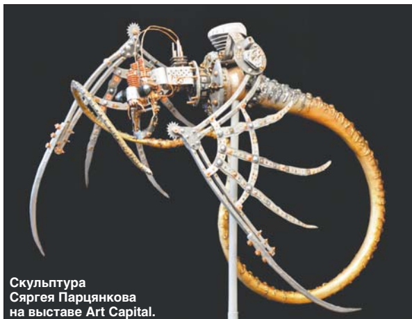
Скульптура Сяргея Парцянкава на выставе Art Capital.