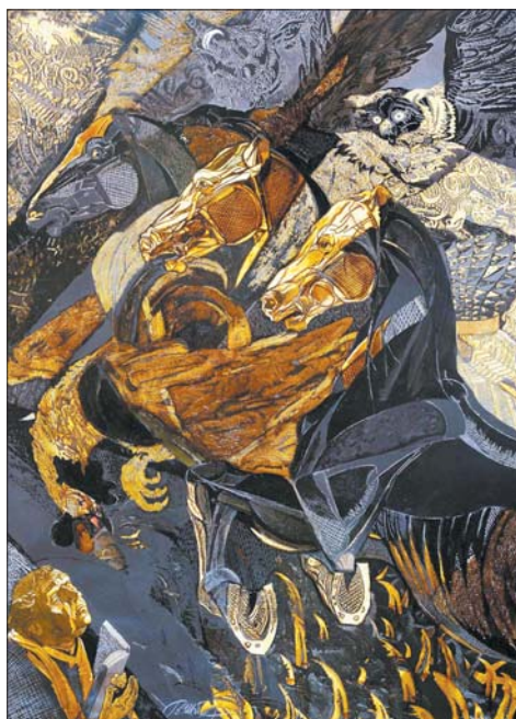
Карціна Валянціны Шобы на выставе Art Capital.

Ірэна КАЦЯЛОВІЧ. katsyalovich@vziazda.by