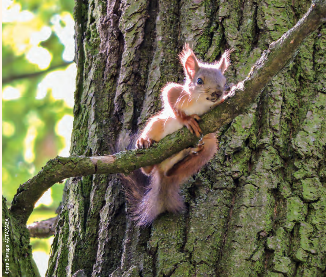
Фота Віктара АСТАХАВА

© Міністэрства прыродных рэсурсаў і аховы навакольнага асяроддзя Рэспублікі Беларусь, 2022