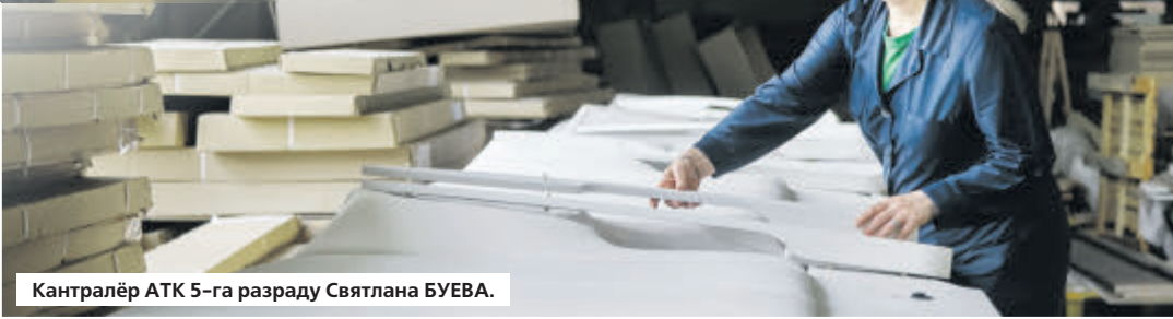
Кантралёр ATK 5-га разраду Святлана БУЕВА.

Гаворачы пра якасць, на прадпрыемстве зазначылі, што ў 2005 годзе тут была ўведзена