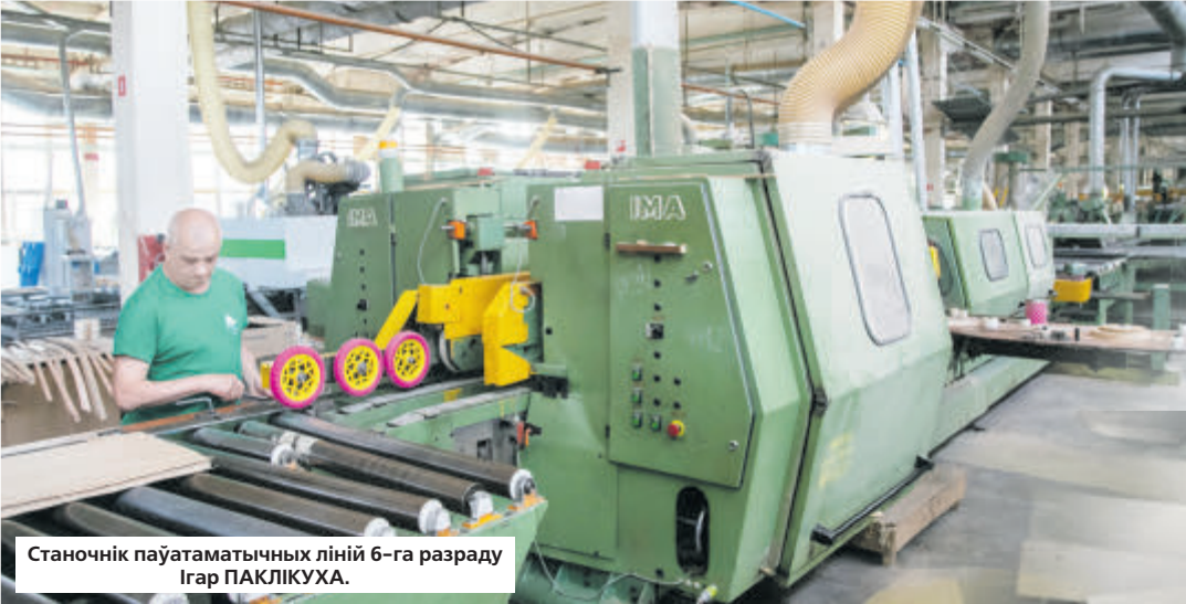
Станочнік паўтаматычных ліній 6-га разраду Ігар ПАКЛІКУХА.

Асабліваю ўвагу, паводле яе слоў, на фабрыцы ўдзяляюць таксама мадэрнізацыі вытворчасці, ды і пра бяспэку не забываюць: «Патрэбна ісці ў