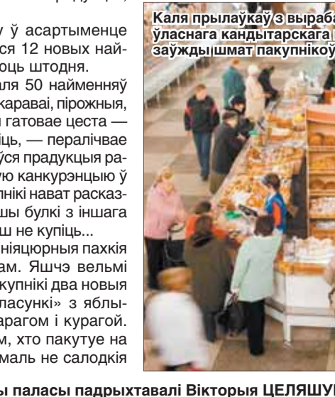
Каля прылаўкаў з вырабамі ўласнага кандытарскага цэха заўжды шмат пакупнікоў!

Матэрыялы паласы падрыхтавалі Вікторыя ЦЕЛЯШУК, Валяр'ян ШКЛЕННІК, Аляксандр ФУРСАЎ.