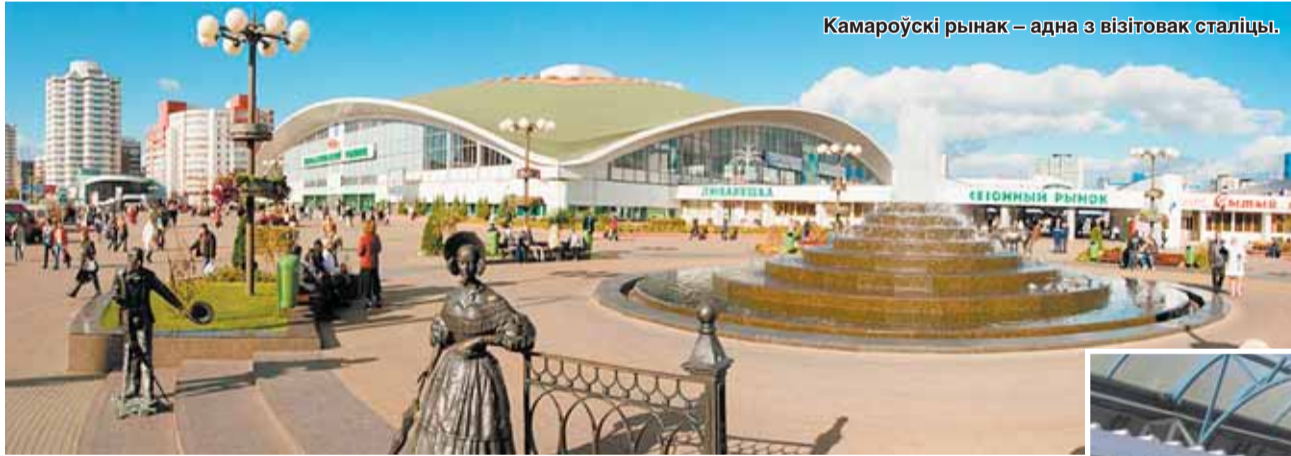
Камароўскі рынак — адна з візітоўка сталіцы.

Зрэшты, і знутры Камароўка добра знаёмая большасць мінчан і гасцей сталіцы. Рупліва гаспадыні ведаюць: на крытым рынку багаты выбар мясной і малочнай, хлебабулачнай прадукцыі і бакалеі; а на адным з радкоў можна набыць малочныя прадукты з асабістых падворкаў — свежыя і, што немагавжна, правяраныя лабараторыяй ветсанэкспертызы сыр, тварог, масла і смятану. А вось разнастайны агароднін і садавіну, ягады і грыбы пакупнікі выбіраюць у трох сектарах сезоннага рынку. Чацвёрты сектар прапануе наведнікам свежамарожаную рыбу і прэсервы, пяты прадстаўлены для рэалізацыі фірмовай прадукцыі беларускіх вытворцаў. Усё гэта ж у фармаце фірменнага гандлю на Камароўскім прадстаўлена прадукцыя 50 айчынных вытворцаў харчавання. А калі запынуць аб'ядаюць быць доўгімі, бацькі могуць пакінуць дзетак ад 3 да 7 гадоў на вопытных выхавальнікаў ва ўтульным «Дзіцячым пакоі» — прычым гэтая паслуга для наведнікаў бясплатная.