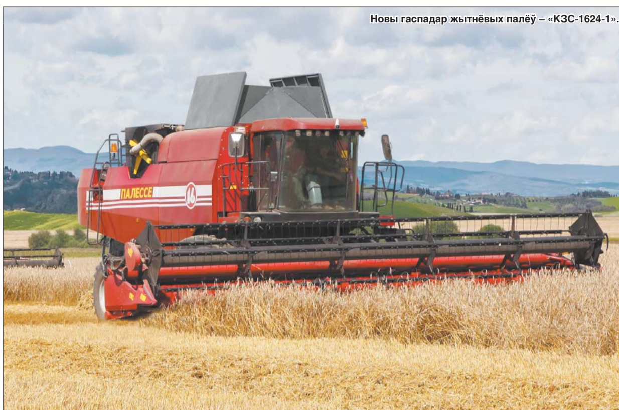
Новы гаспадар жытнёвых палёў — «КЗС-1624-1».

І былі пытанні, звязаныя з якасцю выканання. Усе гэтыя нюансы мы дпрацавалі, сёлета ўжо ў вытворчым плане. Тут ёсць некаторыя праблемы, калі ўсё ж недастаткова аснашчана вытворчасць ці пакуль не набраліся вопыту выканаўцаў. Тыя, хто непасрэдна вырабляе машыны. Хоць збожжаўборачную тэхніку мы выпускаем не першы год, і рабочыя і інжынерна-тэхнічны персанал цудоўна