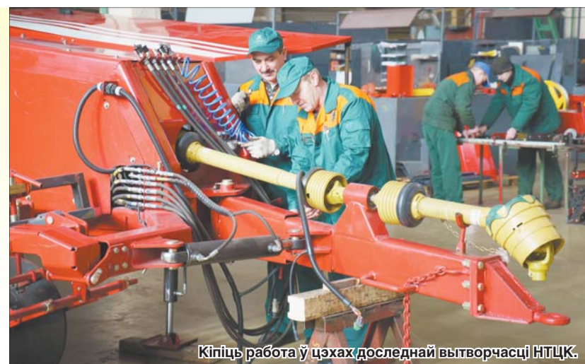
Кіруючы работай у цэхах доследнай вытворчасці НТЦК.

— Праведзеныя намі маніторынг і партнёрскія і нашых машын паказвае, што з замежнымі канструктарамі і вытворчым ідэям плячо ў плячо. Магчыма, крыху адчуваецца розніца ў якасці камплектацыйных дэталей. Толькі таму, што яны выкарыстоўваюць камплектацыю самых славутых фірмаў, а мы імкнёмся даць работу і нашым айчынным прадпрыемствам. Некаторыя з іх, магчыма, крыху слабіейшыя чыста тэхнічна, чым «Гомсельмаш», там не менш стараемся іх падцягнуць па ўзроўні надзейнасці да той ступені, якая нам патрэбна.