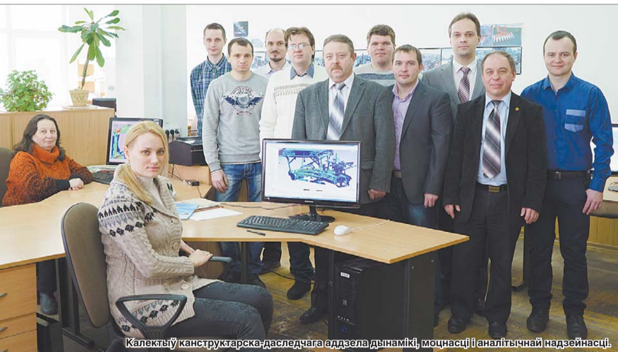
Калектыву канструктарска-доследчага аддзела дынамікі, моцнасці і аналітычнай надзейнасці.

Падрыхтаваў Уладзімір ХІЛЬКЕВІЧ. Здымкі з архіва прадпрыемства. УНП 400052396